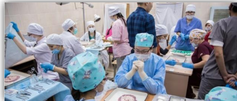
III место на IV региональной олимпиаде по хирургии среди студентов Дальнего Востока (г. Хабаровск)