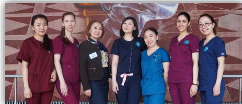
III место во Всероссийской олимпиаде по акушерству и гинекологии имени Л.С. Персианинова (РНИМУ имени Н.И.Пирогова, г. Москва)