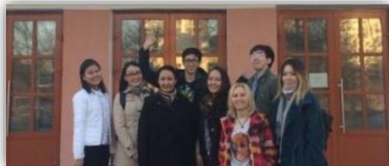
II место на IV Евразийской олимпиаде по неврологии (НГМУ, г. Новосибирск)